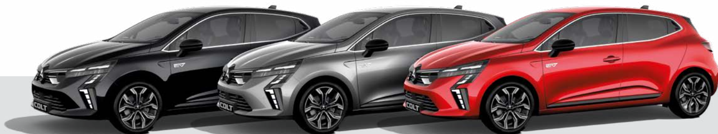
Metalizowany Onyx Black - GNE ▲