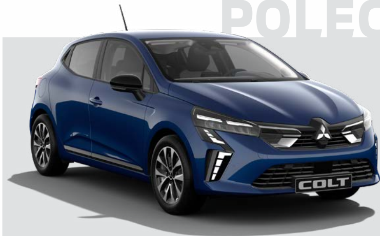
Invite Style + Cold