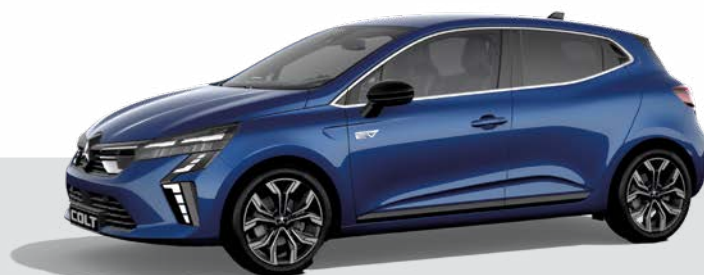
Metalizowany Royal Blue - RQH ▲