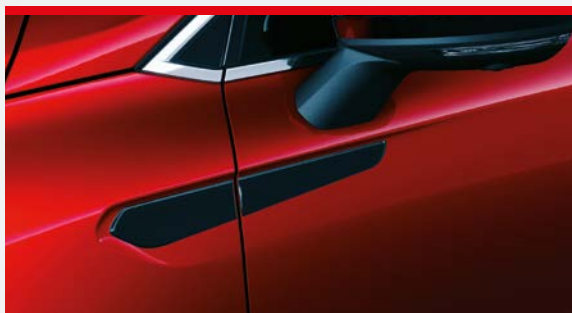
▲ Boczne nakładki Night Black