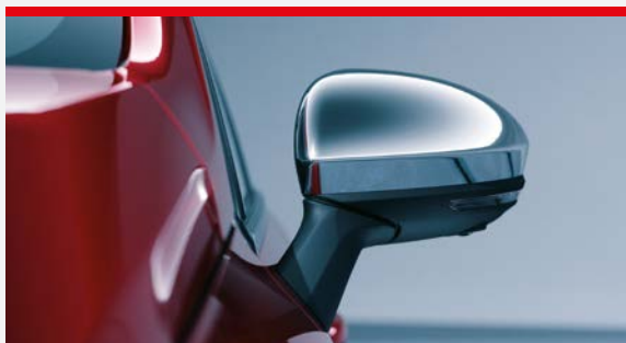
▲ Nakładki ozdobne lusterek (chromowane)