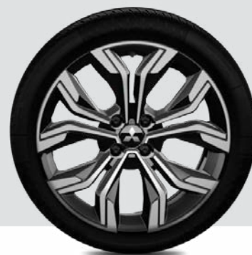
Felgi 17 calowe aluminiowe