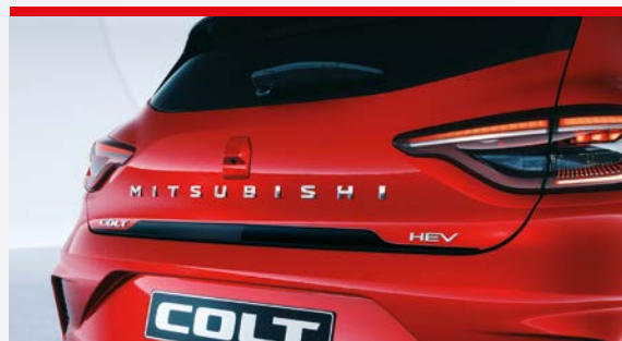
▲ Listwa pokrywy bagażnika Night Black