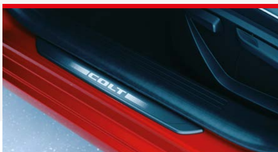
◀ Podświetlane nakładki progowe