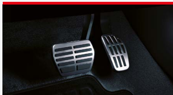
▲ Sportowe nakładki na pedały - MT lub AT