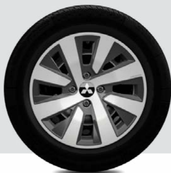
Felgi 15 calowe stalowe