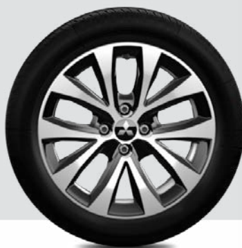
Felgi 16 calowe aluminiowe