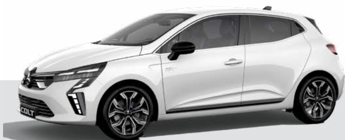
Niemetalizowany Artic White - 369 ▲